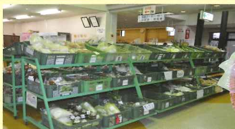
朝取り新鮮野菜を始め、村田町の特産品が豊富に並ぶ。