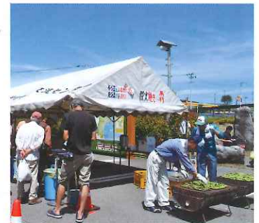
毎年6月に開催される「そら豆まつり」

[路線名] 主要地方道亘理大河原川崎線 [所在地] 宮城県柴田郡村田町大字村田字北塩内41 [電話] 0224-83-5505 [営業時間] 9:00~17:00 [休館日] 月曜日(祝日の場合はその翌日)・12月31日~1月2日