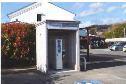
EV充電器 急速充電器を1台設置